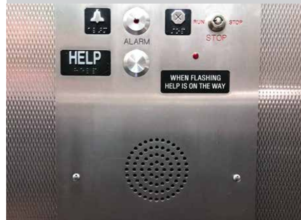
¡Si ocurre atrapamiento, no se asuste! Llama para asistencia.