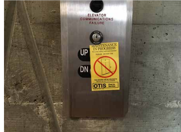
Evitar comportamientos que pueden causar un colapso!