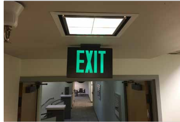
Identificar rutas de evacuación y ubicaciones seguras en el lugar de la localidad