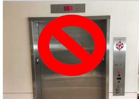
Mientras evacua, evite usar elevadores