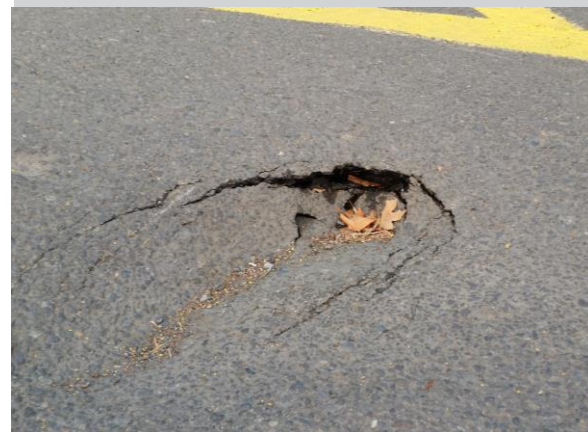
Aprender como reconocer y reportar riesgos antes que incidentes ocurran