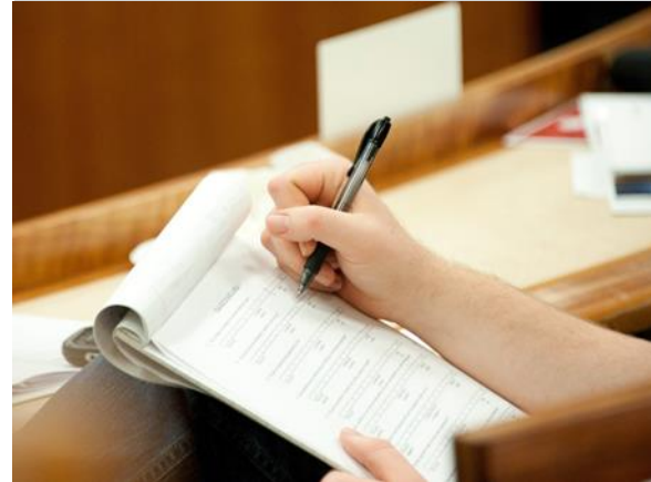
Baje y complete un SIAR con su supervisor